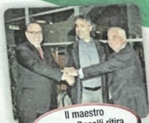
Il maestro Andrea Bocelli ritira il premio Arno