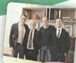
ConCREDITO aiuta "ARNo"

UN GESTO CHE PER TE NON COSTA NIENTE PER NOI HA UN VALORE GRANDISSIMO COME FARE?