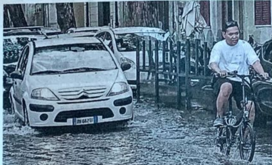
MALTEMPO Acqua alta nelle strade della Darsena

PIOGGIA e grandine per pochi minuti si sono abbattuti ieri, tra le 13.30 e le 14, su tutta la città. E' andata peggio alla Darsena, dove in pochi minuti s'è allagata tutta la zona, strade e piazzali, a sud di via Coppino: auto a passo d'uomo, strade come fiumiciattoli, moto ondoso causato dal transito dei veicoli. Il rallentamento della circolazione provocato un contraccolpo in via Coppino dove, nella corsia verso mare, s'è formato un ingorgo colossale fino al ponte di Pisa.