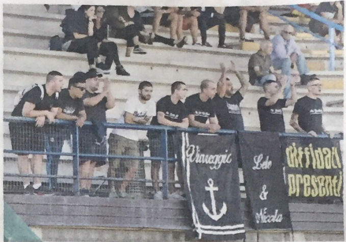
Il manipolo di Ultras del Viareggio presente sulle tribune dello stadio di Castelfiorentino.

Oggi, intanti, è prevista la ripresa degli allenamenti per preparare il derby di domenica al Buon Riposo con il Seralvezza Pozzi. —