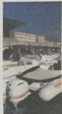
SERVIZI - anche il ritiro di prodotti usati

Ampla la gamma di servizi offerti da SecondLife Service che oggi rappresenta l'unica alternativa Mondiale di servizi dedicati alla riparazione delle parti pneumatiche, l'unica realtà organizzata, professionale e affidabile. Tra gli ambiti di competenza quella di eseguire riparazioni con tecnici professionali e qualificati. Qui ogni singola attività è interamente svolta con protocolli rigorosi, finalizzati a garantire tempi certi e affidabilità degli interventi. Ma non solo: oltre a riparare, ricostruire e sostituire parti pneumatiche, si occupa anche della vendita e del ritiro prodotti usati e propone corsi di formazione. "Crediamo