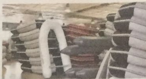
L'azienda conta su personale altamente qualificato

e professionalità omogenea, lavorazioni e servizi garantiti, durevoli ed economici attraverso l'impiego di tecniche tradizionali ma anche nuove tecnologie e tecniche brevettate proprio dalla Casa Madre e alla presenza di personale altamente qualificato, in grado di guidare il cliente nella scelta più adatta per la costruzione di un nuovo battello, per il refitting del proprio tender.