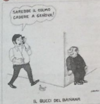
IL BUCCI DEL BANANA

Centrodestra avanti. Pizzarotti confermato sindaco a Parma. Primi exit poll: nella «rossa» Genova dovrebbe vincere Marco Bucci, il candidato che ha unito il centrodestra. In vantaggio anche a Verona dove viene sconfitta la candidatura di Tosi. Testa a testa a L'Aquila. Trapani — con un unico candidato —, non raggiunto il quorum.