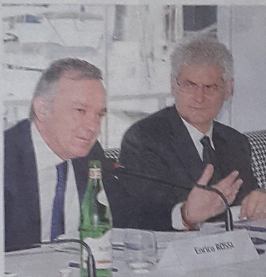
«VERSILIA RENDEZ VOUS» Un momento della presentazione della mostra nautica di maggio in Darsena: il governatore Rossi e Paoletti

particolare in 10 anni ha realizzato centoventi progetti di innovazione, di internazionalizzazione del prodotto e oltre dieci milioni di euro di finanziamento alle imprese. Organizza Yare (Yachting AfterSales Refit Experience) salone dedicato al settore superyacht, punto d'incontro internazionale dello yachting. Tra gli scopi d'impresa più importanti, e che si spo-