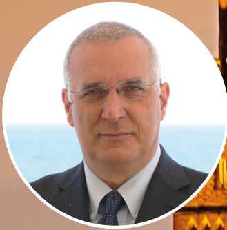
Giuseppe Pignatelli Banca Progetto

LOCAZIONE FINANZIARIA E NOLEGGIO, FACTORING E FINANZIAMENTI A MEDIO-LUNGO TERMINE