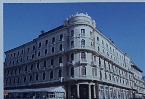
Grand Hotel Principe di Piemonte

QUANDO: giovedì 27 aprile DOVE: Viareggio, Grand Hotel Principe di Piemonte (piazza Puccini n. 1) ORARIO: dalle ore 9,30