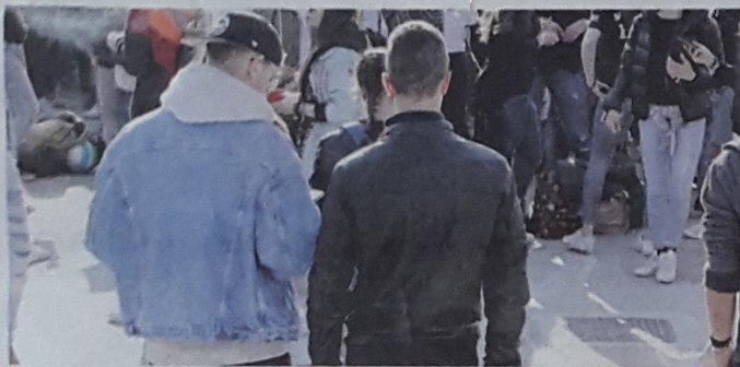
La festa dei 100 giorni alla maturità in città

A quel punto il ragazzo ha cominciato a seguirli, mentre i compagni di classe chiamavano la polizia. Dando la descrizione dei ladri al commissariato, che inviava due volanti a caccia dei responsabili. Quando il ragazzo derubato è riusci-